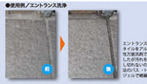
●使用例/エントランス洗浄 エントランス磁器タイルをアルカリ性万能洗浄剤で洗浄した汚れを落とすのに最適なジェルタイプです。 使用例：エントランス洗浄

それでは「スルファミン酸の何が良いの？」を説明する前に酸についての説明を図にまとめましたのでご参照ください。【図1】