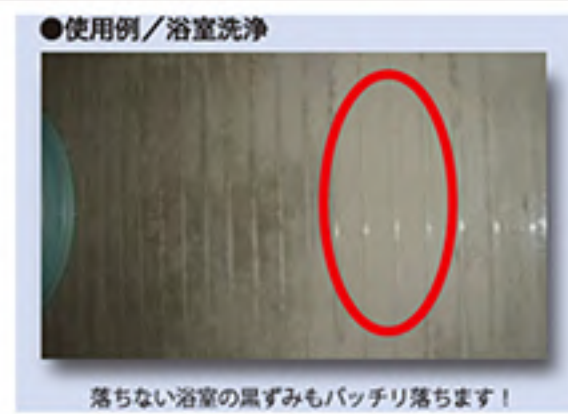
●使用例/浴室洗浄 落ちない浴室の黒ずみもバッチリ落ちます！ 使用例：浴室壁面洗浄

例としてエントランスの磁器タイルの汚れがアルカリ万能洗浄で除去しきれなかったのが本製品で綺麗に！なんて声も。使用例をご参照ください。更にジェルタイプですので壁面などの垂直面でも滞留して効果を発揮します。そしてハウスクリーニング作業のレベルアップには是非ご使用いただきたい製品でございます。