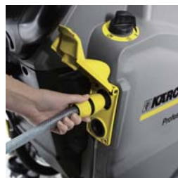
自動的に給水が止まる「ワンタッチ給水システム」。※プレミアムタイプ