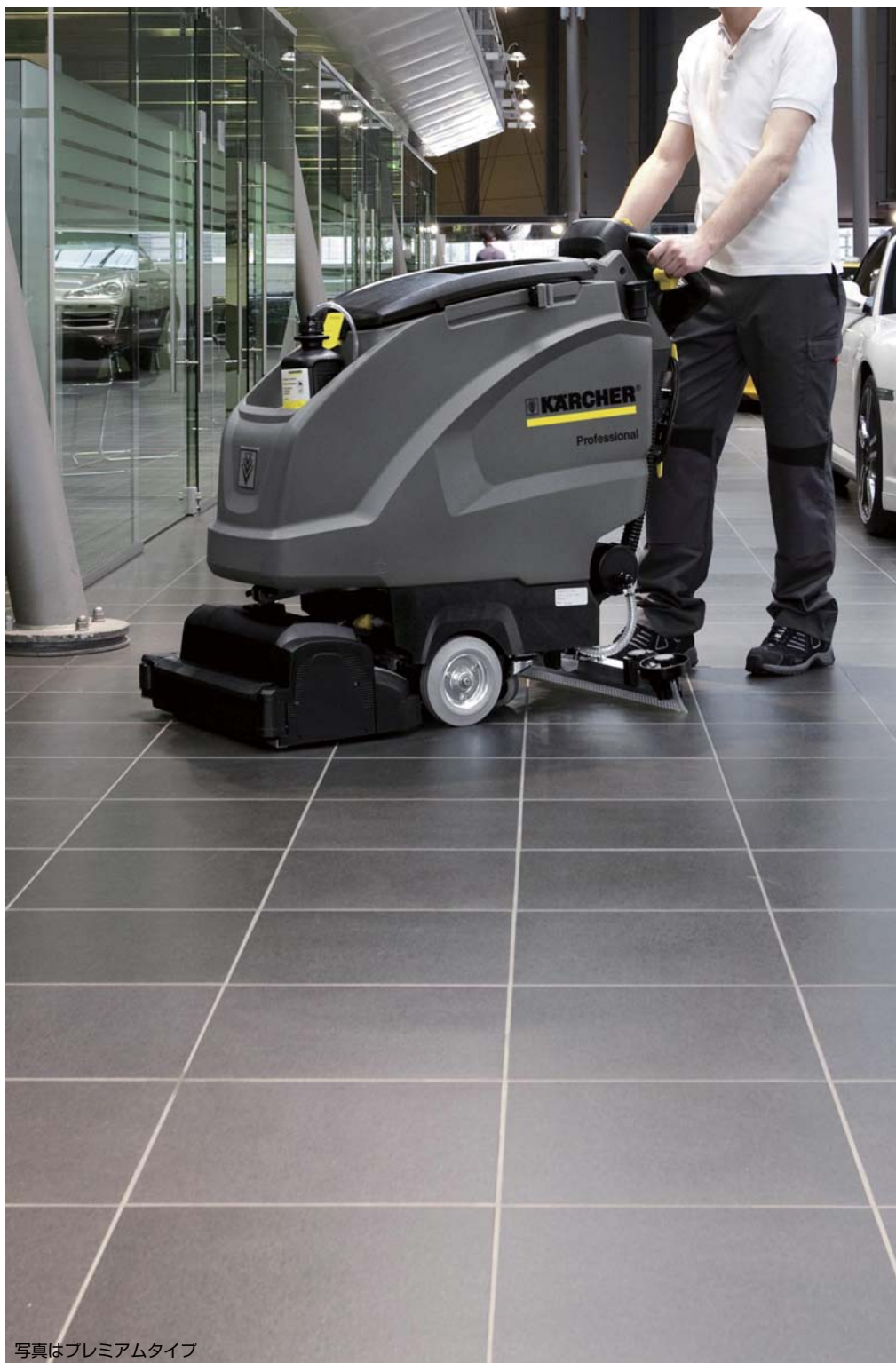
写真はプレミアムタイプ

高い清掃能力のローラーブラシで効率的な清掃 (BR タイプ) 作業コストの削減はケルヒャー 床洗浄機から