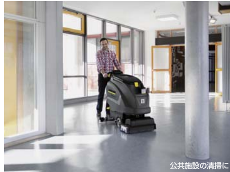
公共施設の清掃に