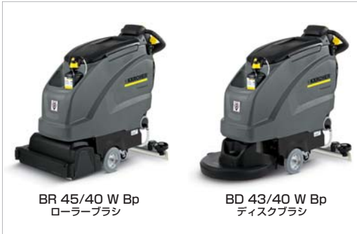
BR 45/40 W Bp ローラーブラシ

高い清掃能力のローラーブラシで効率的な作業 (BR タイプ) 作業コストの削減はケルヒャー 床洗浄機から