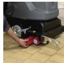
ブラシやスクイジーの交換は工具不要。調整も簡単。