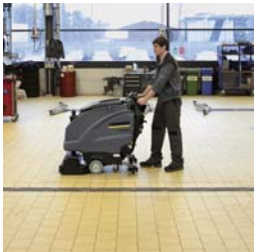
軽く押すだけの自走式。

自走式のため、作業の際や移動時の負担を軽減します。また、作業者が操作するスイッチ類は色分けされており、操作ミスを防止します。