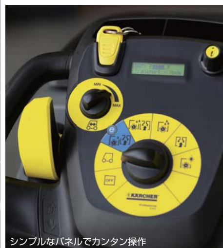
シンプルなパネルでカンタン操作