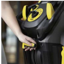
操作系のスイッチは黄色で統一。誤操作を防止。