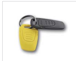
鍵管理システム (KIK / ケルヒャー・インテリジェンス・キー)

世界初の鍵管理システム (KIK) を採用。2種類の鍵で権限を分け、管理者が清掃内容を設定し、作業者は設定の範囲内で清掃を行います。作業者を選ばずどなたでも均一な清掃結果が得られます。