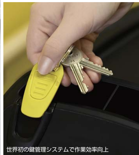
世界初の鍵管理システムで作業効率向上